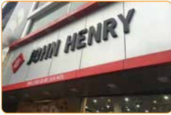
BIỂN QUẢNG CÁO TRÊN MỌI CHẤT LIỆU