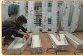
CHỮ NỔI TRÊN MỌI CHẤT LIỆU