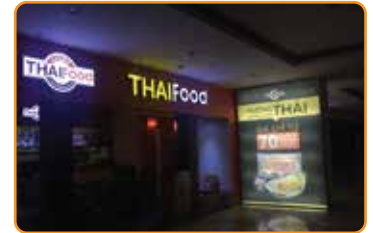
BIỂN HỘP ĐÈN CÁC LOẠI