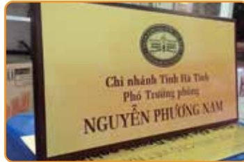
BIỂN PHÒNG BAN CHỨC DANH, TÒA NHÀ