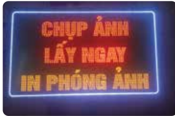
BIỂN LED VẼY LED MA TRẬN