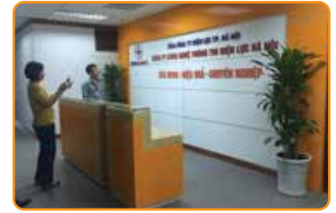
QUẦY LỄ TÂN BACKDROP LỄ TÂN